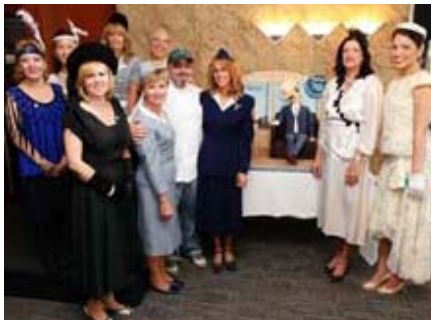
1930년대 복장을 한 라운지 직원들이 1939년 Admirals Club의 첫 개장을 축하하고 있습니다.

아메리칸 항공은 $70 특별 절약 기회와 생일 경품권을 제공하는 70 일간의 기념 행사를 실시합니다.